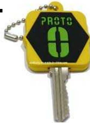
a key カギ