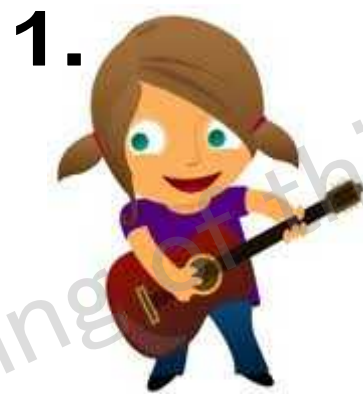
a guitar ギター