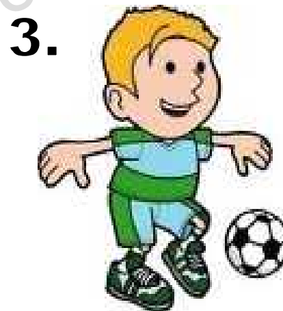
a ball ボール