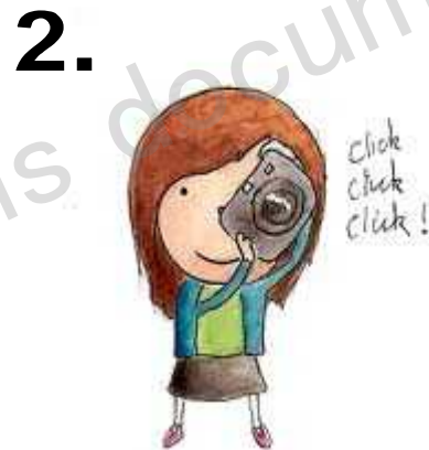
a camera カメラ