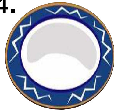
a dish お皿