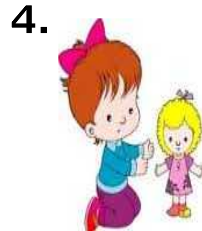
a doll 人形