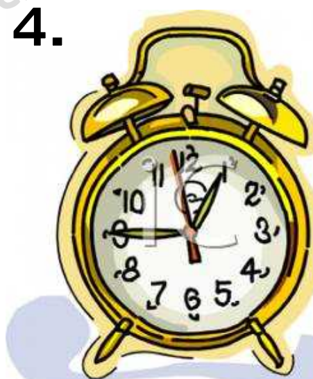
a clock 時計