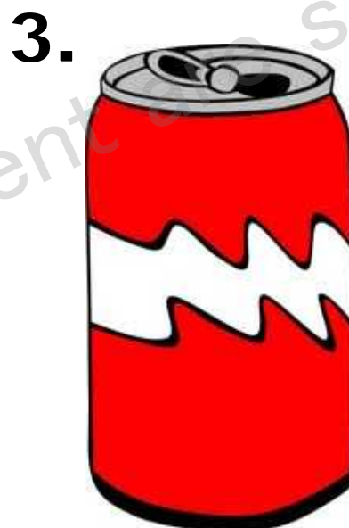
a can カン