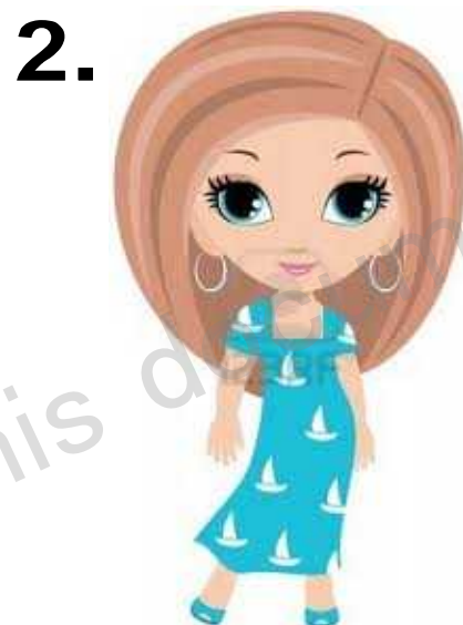
a woman 女の人