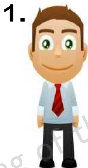
a man 男の人