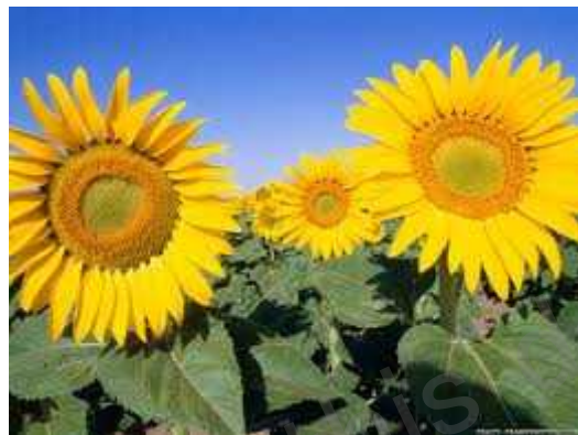
1 Sunflowers ひまわり